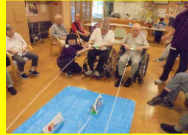
☆スイカ割りゲーム☆